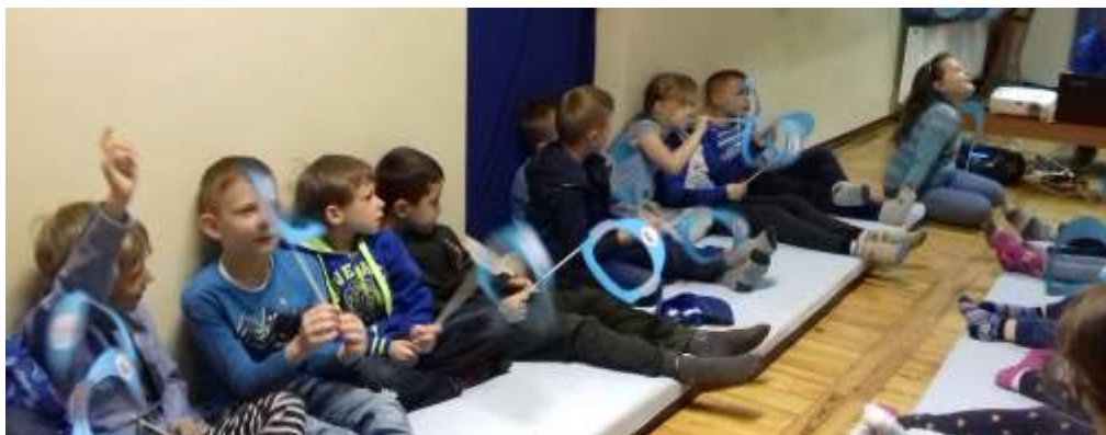
DZIADY - kiedy nauczyciel to pasjonat...